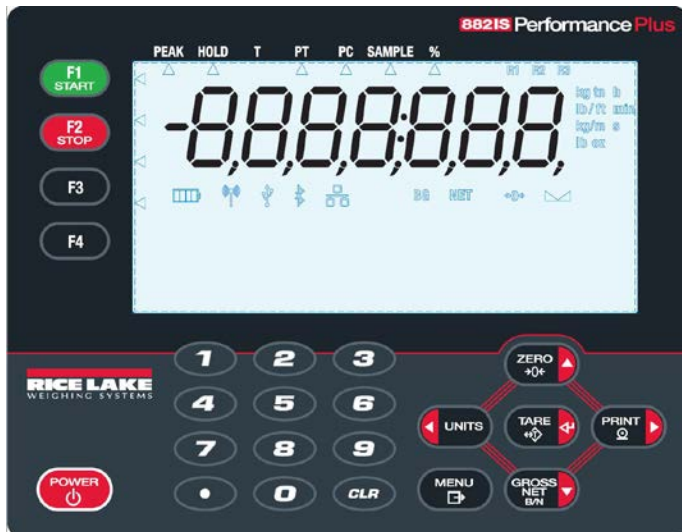
Typical Display for model 882IS Plus/ Afficheur typique pour modèle 882IS Plus