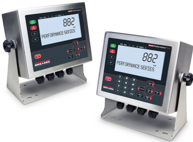
Typical Models 882IS and 882IS Plus / Modèles typique 882IS et 882IS Plus