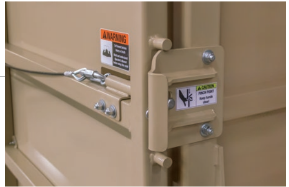
Conjunto de cierre de gran resistencia