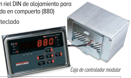
Caja de controlador modular