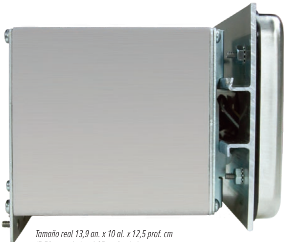
Tamaño real 13,9 an. x 10 al. x 12,5 prof. cm (5,50 an. x 4 al. x 4,95 prof. pulg.)