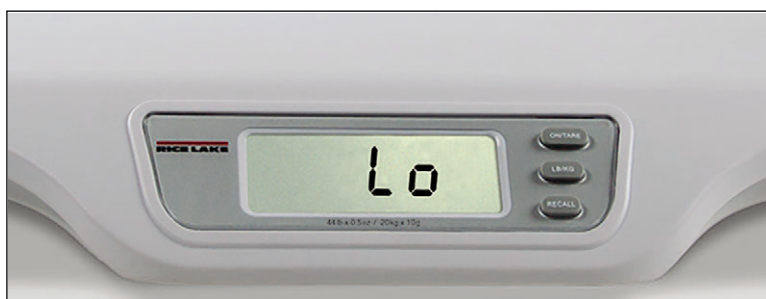
Figura 2-2. Indicador de carga baja de batería

La báscula RL-DBS también puede recibir alimentación de 4 baterías alcalinas AA en caso de no contar con una fuente de alimentación adicional. Una báscula alimentada por baterías se apagará de forma automática tras 2 minutos en desuso para prolongar la duración de la batería. Reemplace las baterías o conecte a una fuente de alimentación de CA lo antes posible si aparece el indicador de carga baja de batería ( Lo ).