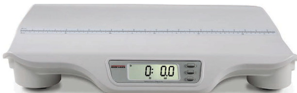
Figura 1-1. Báscula digital de infante RL-DBS

Encontrará información sobre la garantía en www.ricelake.com/warranties