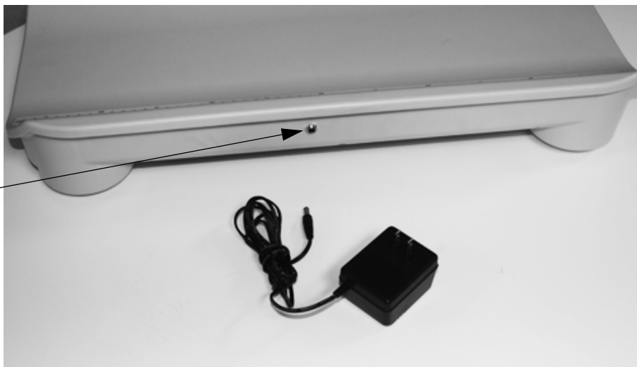
Figura 2-1. Ubicación del conector de la alimentación c.a.

Ubicación del conector de la alimentación c.a.