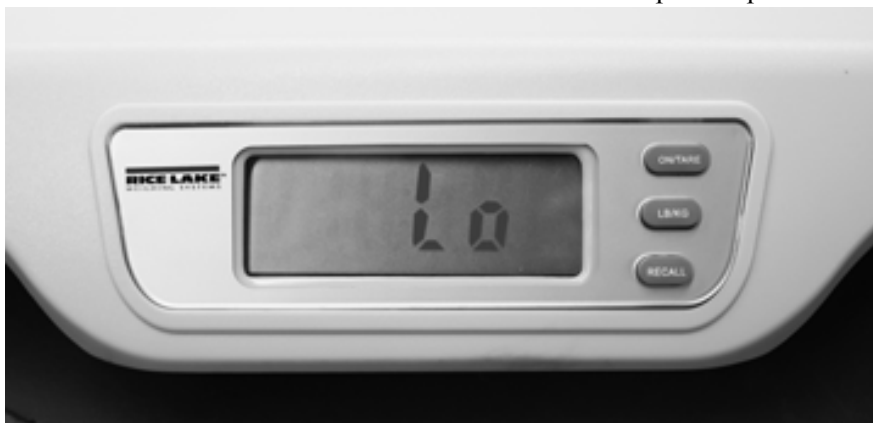
Figura 2-2. Indicador de batería baja

La Báscula Digital de Bebés RL-DBS también tiene la capacidad de operar en base a cuatro baterías AA si no hay una fuente de alimentación adicional disponible. Si el aviso Lo está mostrado en la pantalla, reemplacen la batería o conecten la báscula a una fuente de alimentación c.a. lo más antes posible para mantener pesaje preciso.